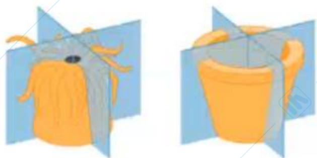
(a) Simmetria radiale