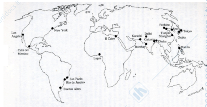
Megalopoli / Mega-cities + 20 milioni di abitanti

I paesaggi collinari "della qualità" (estetica, ecologica, economica). Mosaici culturali, prevalentemente a oliveto e vigneto, caratterizzati da una maglia agraria articolata e ben infrastrutturata dalla rete rurale (muretti a secco e terrazzamenti, siepi, filari, alberi isolati, lingue di bosco, viabilità poderali).