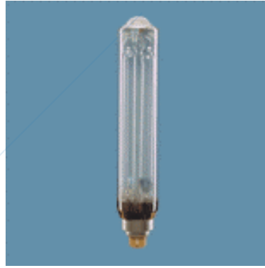
Lampada a vapori di sodio a bassa pressione.