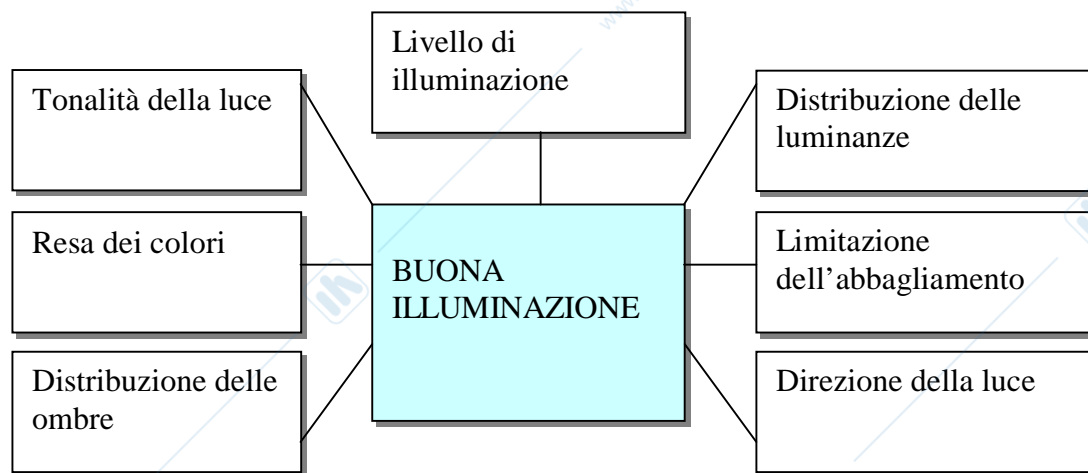
Componenti del progetto illuminotecnico (Doc. OSRAM).

Il fattore di manutenzione è il rapporto tra l'illuminamento prodotto da un apparecchio dopo un certo periodo e quello dello stesso apparecchio nuovo. Esso tiene conto della perdita di flusso luminoso che si verifica a causa dell'invecchiamento delle lampade e dell'insudiciamento dell'apparecchio e viene di norma fornito dalle ditte costruttrici. Anche la riduzione della capacità di riflessione delle pareti influisce sul fattore di manutenzione.