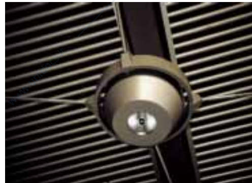
a) Zumtobel , design Corona, Wilmutte; b) Saturn , design Foster & Partners.