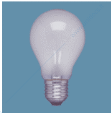
Lampada ad incandescenza (Doc. OSRAM).