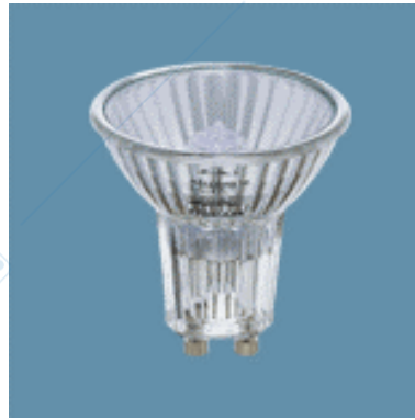
Lampada alogena con riflettore incorporato.

Ne consegue che la luce emessa dalle lampade ad alogeni con riflettore dicroico, o più brevemente dicroiche, è una luce più fredda, sia dal punto di vista termico che cromatico, priva del 66% della radiazione infrarossa emessa da una lampada ad alogeni con riflettore in alluminio di pari potenza.