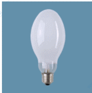
Lampada a vapori di mercurio (Doc. OSRAM).

Nell'illuminazione stradale i vantaggi sopra indicati risultano ancora più importanti, soprattutto la concentrazione del flusso, che consente di ridurre il numero dei centri luminosi e quindi di ridurre fortemente le spese di installazione, dato l'elevato costo dei sostegni.