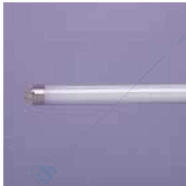
Lampada fluorescente lineare Ø 16 mm (Doc. OSRAM).