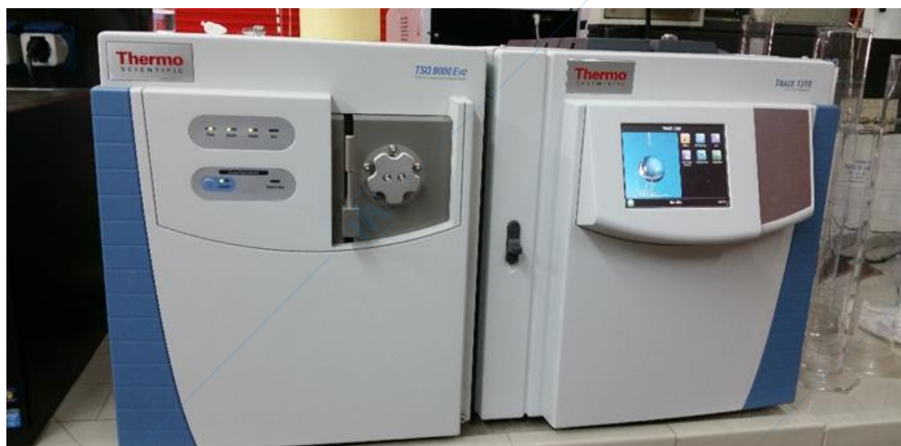
Figura 1: GC-MS Thermo 1310-Tsq8000Evo

L'esperimento ha lo scopo di realizzare una separazione di una miscela di alcoli mediante l'utilizzo di un gas cromatografo dotato di rivelatore a spettrometria di massa. Lo strumento è mostrato in Figura 1