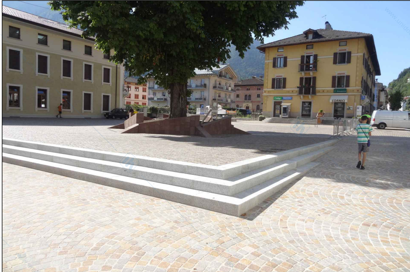
Immagine di sfondo