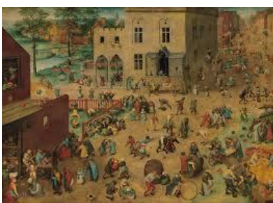
Bruegel, "Giochi dei bambini" 1560