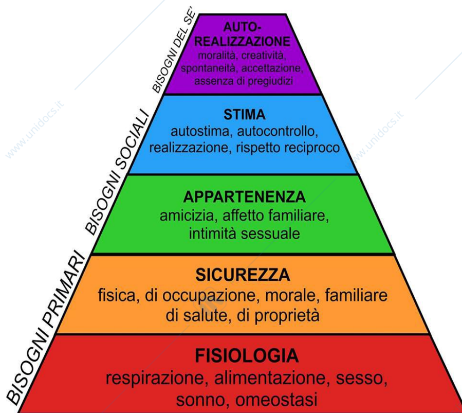
La piramide dei bisogni Maslow (1954)

bisogni è suddivisa in cinque differenti livelli, dai più elementari, necessari alla sopravvivenza dell'individuo, ai più complessi, quelli di carattere sociale. L'individuo si realizza passando per i vari stadi, i quali devono essere soddisfatti in modo progressivo. Questa scala è internazionalmente conosciuta come "La piramide di Maslow" (fig.2).