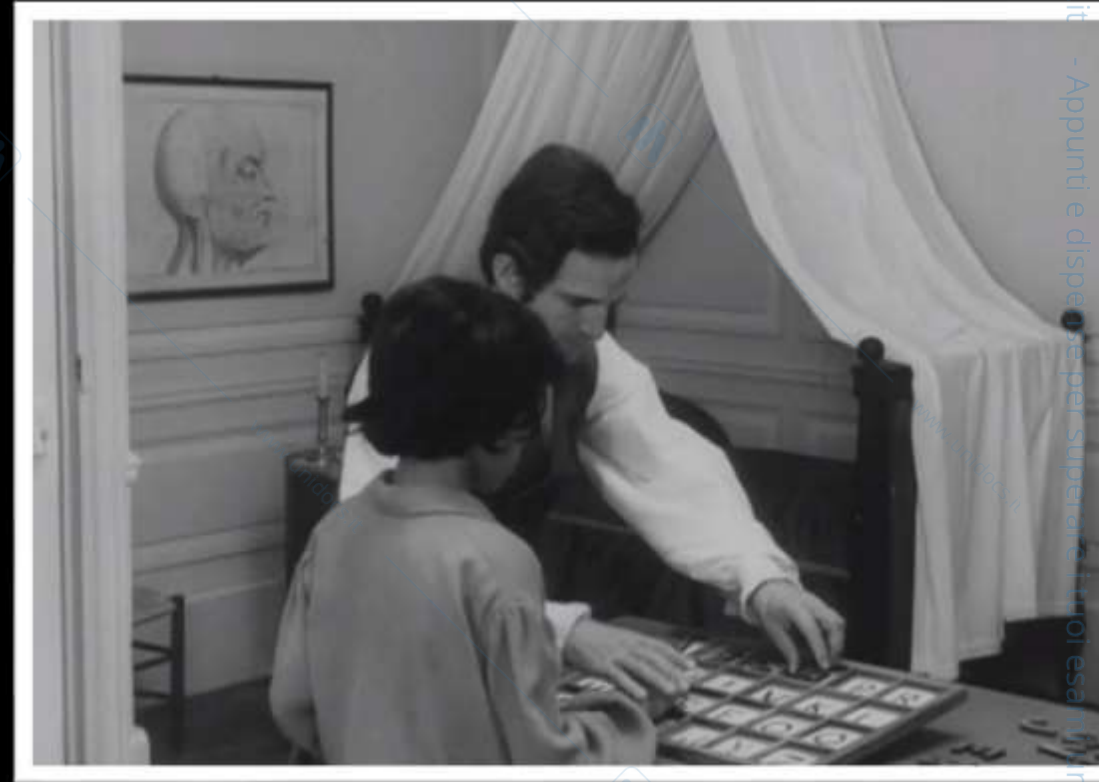
F. Truffaut, L'enfant sauvage , 1970