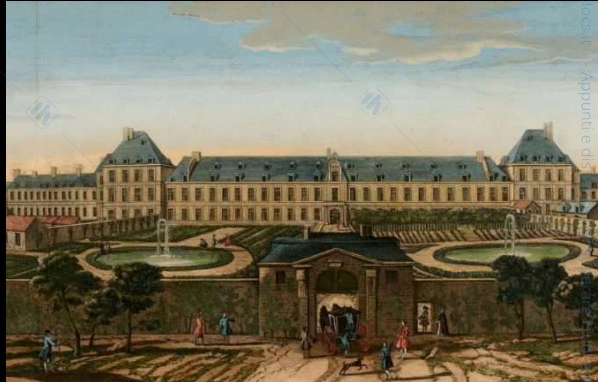
J. Rigaud, Vue de l'hôpital royal de Bicêtre , XVIII secolo, Musée de l'AP-HP

➤ Bicêtre e l'eredità del “grande internamento”