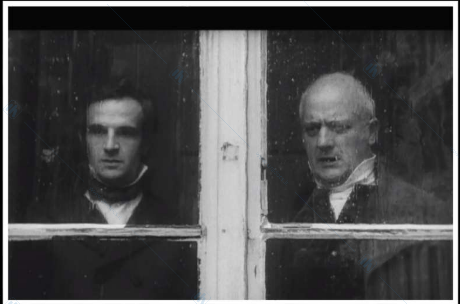
F. Truffaut, L'enfant sauvage , 1970