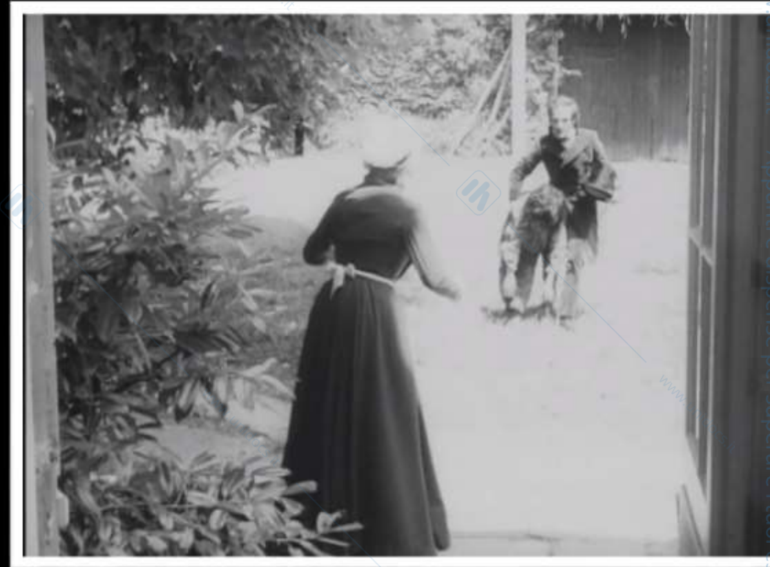
F. Truffaut, L'enfant sauvage , 1970